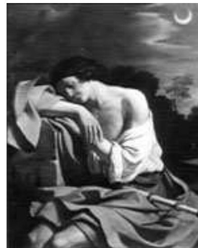
Giovan Francesco Barbieri detto il Guercino Endimione olio su tela, cm 125x105 Roma, Collezione Doria Pamphili

La sezione finale è dedicata alla ricezione dell'eredità di Galileo in direzione di un nuovo rapporto tra le arti e le scienze, documentato nel rinnovamento e nell'evoluzione di un linguaggio figurativo in cui è ora possibile riscontrare, anche in termini simbolici e allegorici, l'insegnamento galileiano.