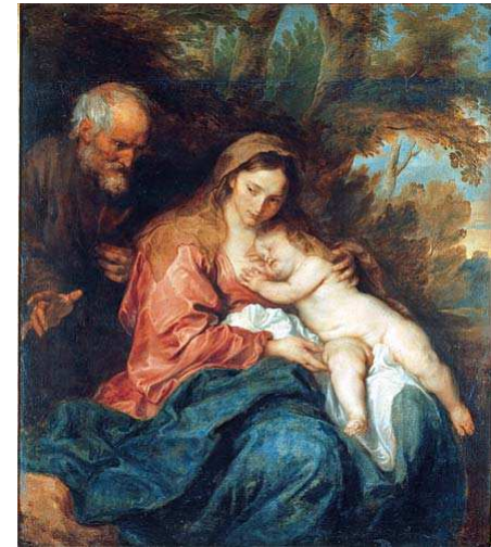
Rubens (copia da) La fuga in Egitto Olio su tela, cm 74 x 105 Paris, Louvre