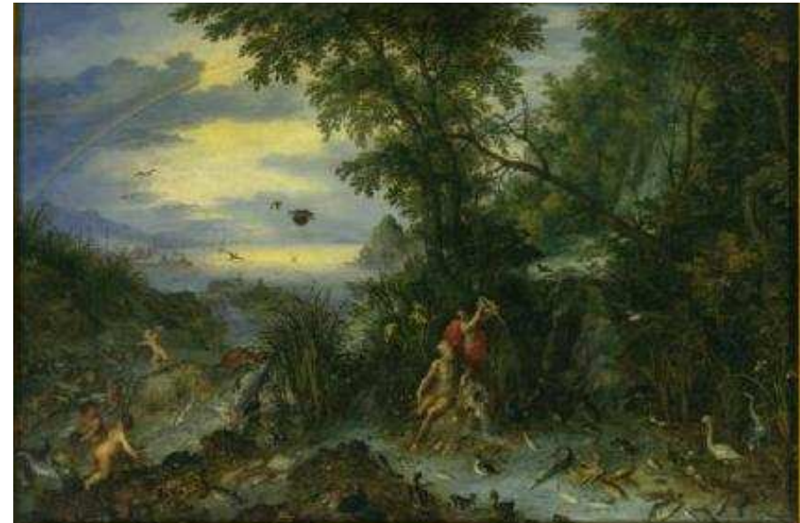
Jan Brueghel Allegoria del fuoco olio su rame, cm 46x66 Milano, Pinacoteca Ambrosiana

Partendo da un celebre passo di Galileo dedicato all’Ariosto, la sezione illustra l’evoluzione, anche in termini galileiani, del collezionismo enciclopedico e della tradizione delle Wunderkammern nell’Europa della prima metà del XVII secolo, con significativi riscontri anche in ambito del collezionismo artistico e dei percorsi del gusto.