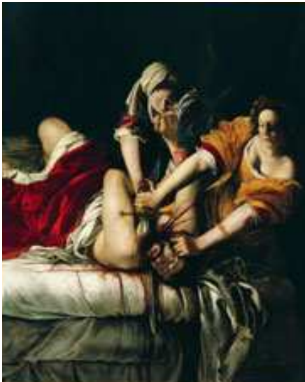
Artemisia Gentileschi, Giuditta e Oloferne olio su tela, cm 188 x 162 Firenze, Uffizi

La sezione è interamente dedicata all'impatto del Sidereus Nuncius e delle prime scoperte astronomiche galileiane sulla cultura figurativa del primo '600 a Firenze, Roma e in tutta Europa.