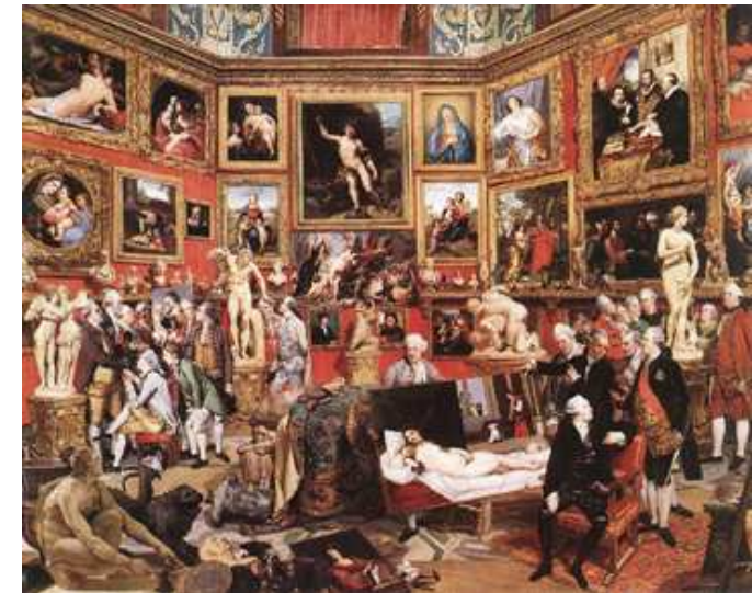
Johann Zoffany The Tribuna of the Uffizi , 1772-78 Royal Collection, Windsor