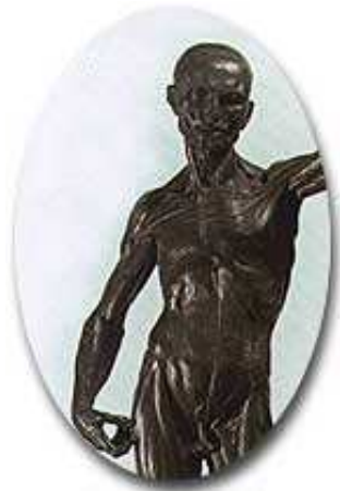
Ludovico Cardi detto il Cigoli Scorticato bronzo su base d’ebano, h cm 65 Firenze, Museo Nazionale del Bargello